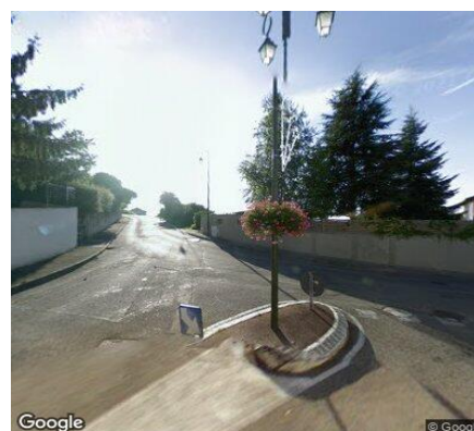
Vue STREET VIEW du secteur